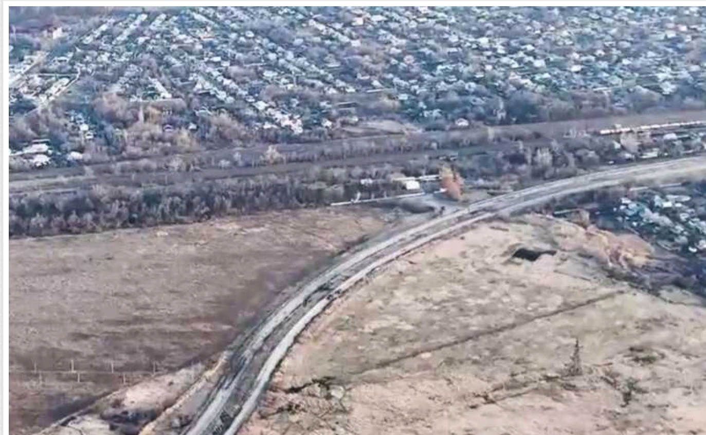
У Донецькій області ЗСУ спалили потужний російський міномет "Тюльпан"

Біля тимчасово окупованого міста Макіївка на Донеччині українські військові уразили 240-мм самохідний міномет 2С4 "Тюльпан".