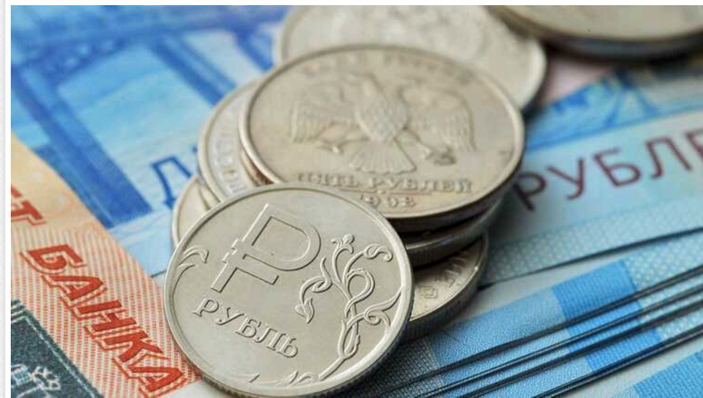
Рубль РФ визнали однією з найслабших валют світу

Російський рубль за підсумками 2023 року показав найсильніше з 2015 року падіння і увійшов до першої трійки рейтингу найслабших валют країн, що відстежує Bloomberg.