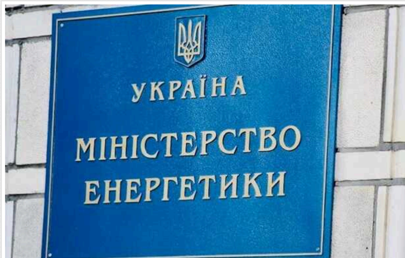
Українських енергетиків перевірять на правомірність видачі броні від мобілізації, - Міненерго

Було виявлено факт зловживання колишнім радником міністра енергетики, якого для ухилення від служби зарахували на роботу до "Черкасиобленерго", яку він ігнорував, отримуючи зарплату.