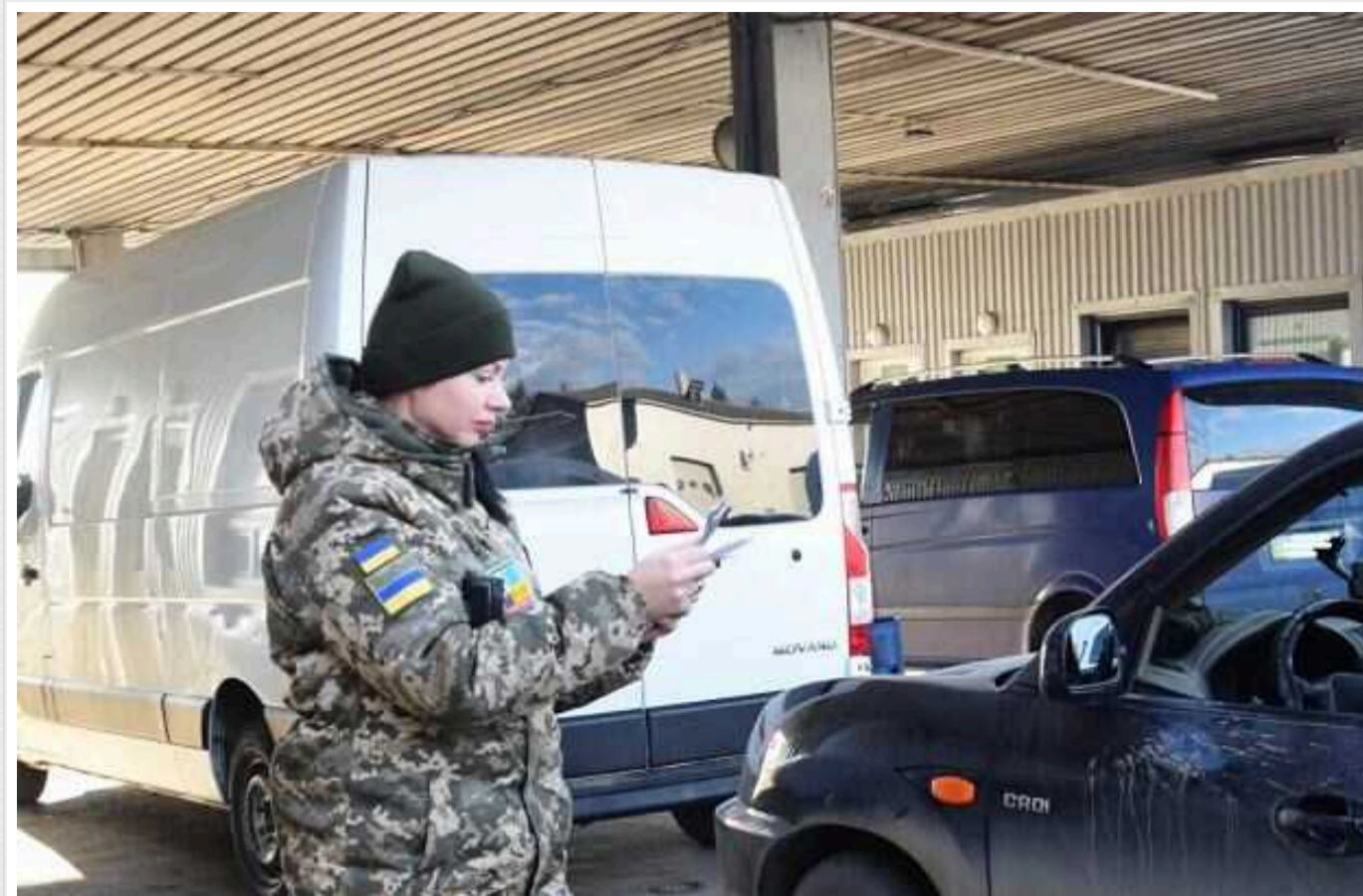
99% українців, які виїхали у 2023, повернулись до України — Opendatabot

Понад 32 млн перетинів кордону було зафіксовано в Україні за 11 місяців 2023 року.