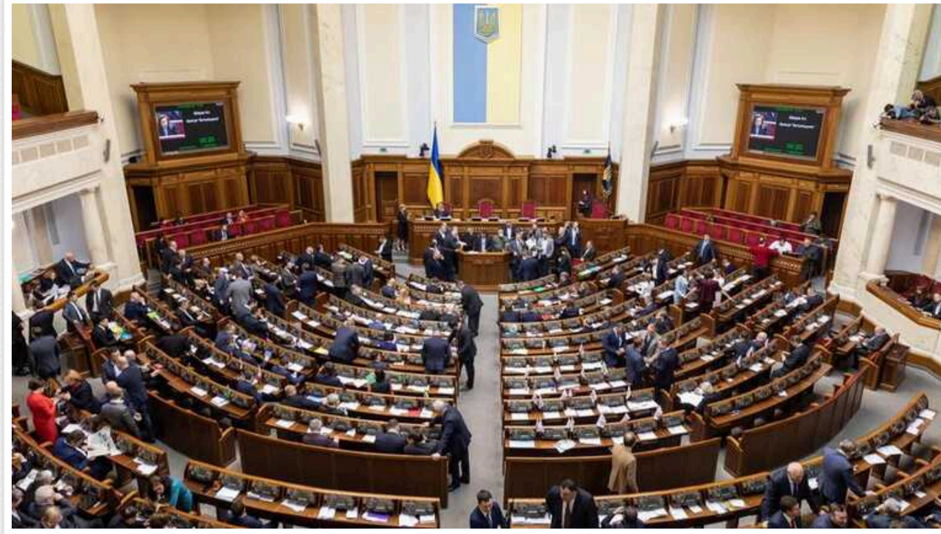
На розгляд Комітету у ВР передали ще один законопроект про мобілізацію, поданий депутатом Гончаренко