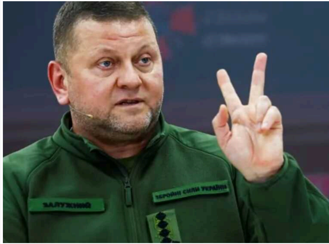
У Чехії розповіли, чому Залужний кілька разів був у Празі перед повномасштабним вторгненням РФ

Міністерство оборони Чехії послало співпрацю з Генеральним штабом Збройних сил України ще до початку повномасштабного вторгнення Росії в Україну. Головнокомандувач ЗСУ Валерій Залужний у межах цієї співпраці приїздив до Праги у січні та лютому 2022 року: з чеськими колегами він обговорював озброєння, яке Чехія могла би передати Україні у разі початку великої війни.