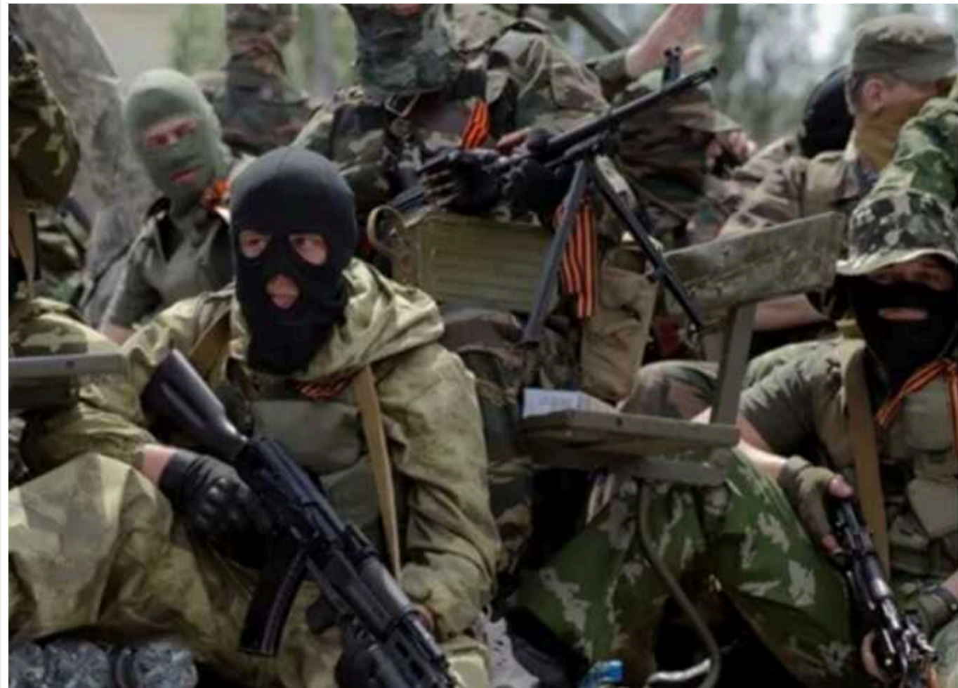
В окупованому Маріуполі на Новий рік ліквідували 17 окупантів, які зібралися пиячити

У Маріуполі активісти українського спротиву децю зменшили "поголів'я" російських окупантів. У новорічну ніч загарбники, що зібралися пиячити у великій компанії, потрапилися отруєним алкоголем, дбайливо приготованим для них маріупольським спротивом.