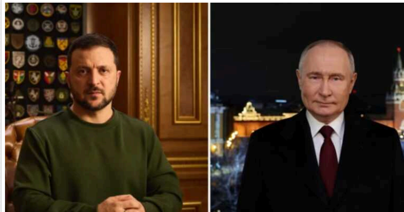
NYT порівняла новорічні промови Зеленського та Путіна і вказала на небезпечну самовпевненість диктатора

Новорічна промова президента України Володимира Зеленського різко контрастувала з посланням російського диктатора Володимира Путіна, який фактично обійшов мовчанням тему війни проти України, намагаючись створити відчуття «нормальності» для росіян.