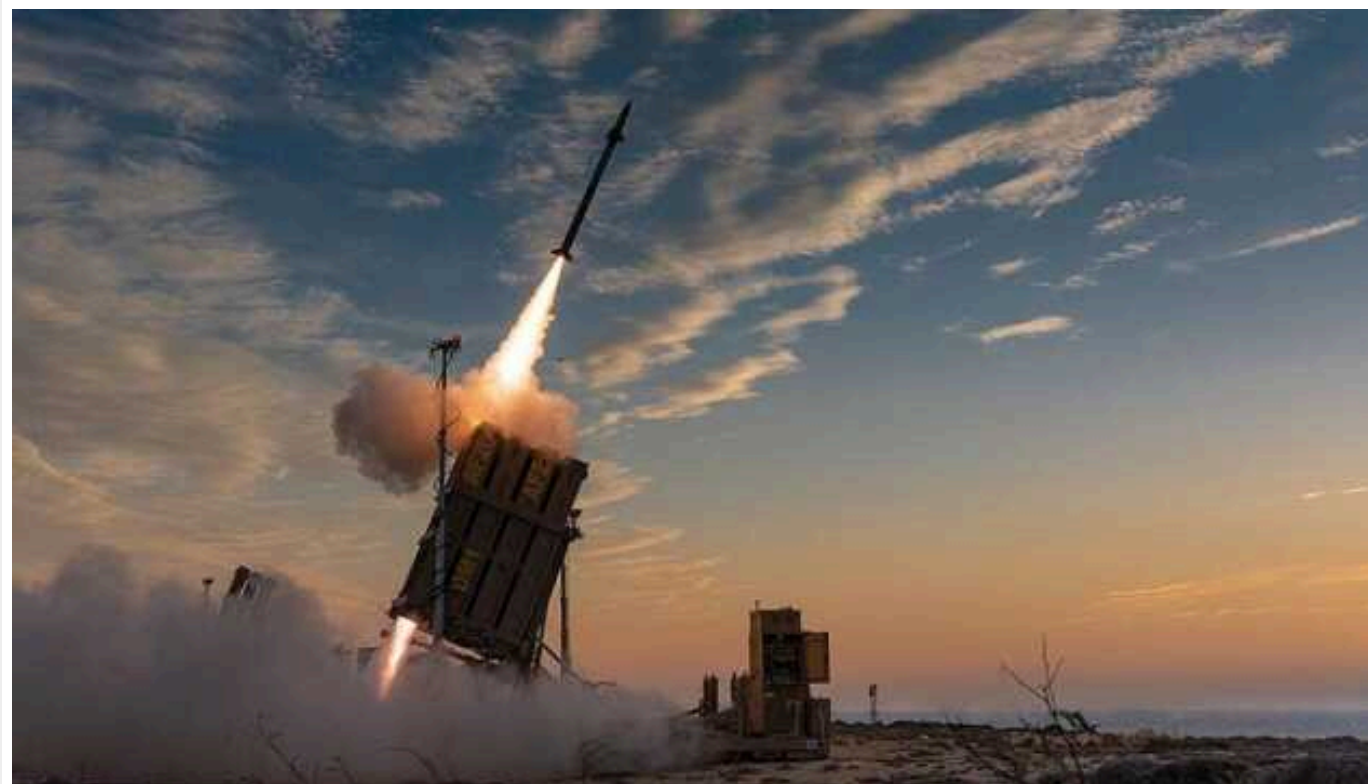
РФ намагається пристосуватися до можливостей ППО України, – ISW

Для України критично важливими залишаються поставки країнами Заходу систем протиповітряної оборони і ракет. Російські військові намагаються пристосуватися до можливостей української системи ППО, щоб навчитися її обходити та завдавати максимальних руйнувань і жертв.