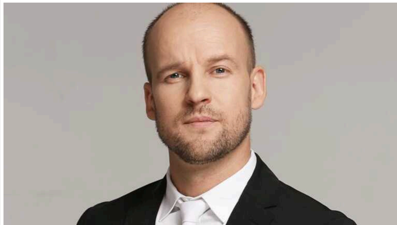
Юрій Великий з "Кварталу 95" попросив вибачення за скандальний номер

У новорічному випуску шоу "Квартал 95" гумористи показали номер, який присвятили "дівчині зі Скадовська", що нині окупований росіянами, та "жителю Закарпаття". Сміштити глядачів повинні були помилки російськомовної українки, яка прагне навчитися грамотно розмовляти державною мовою, але поки їй це не вдається.