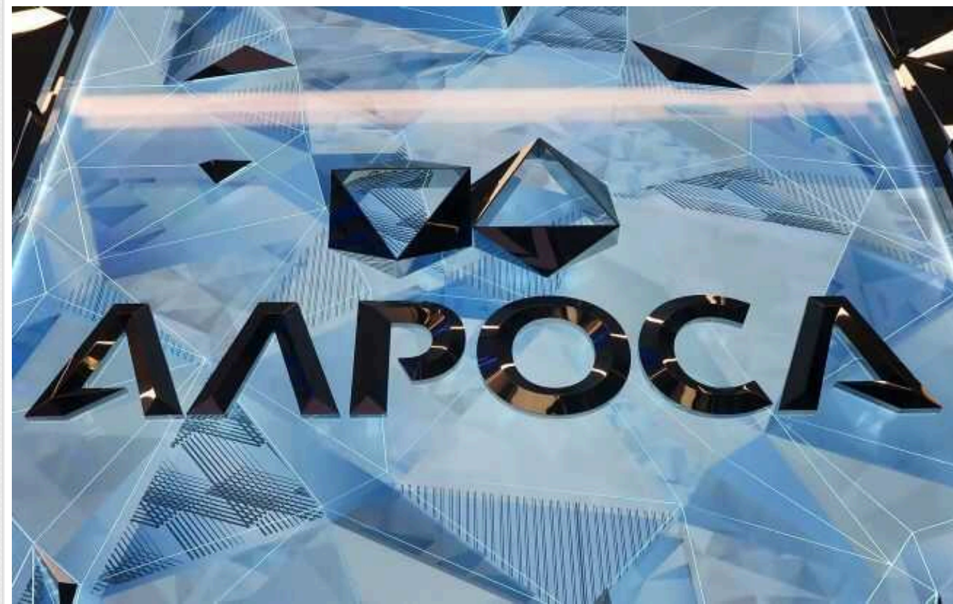
Проти російської алмазної компанії "Алроса" та її гендиректора запроваджено санкції

Рада ЄС запровадила додаткові обмежувальні заходи проти найбільшої російської алмазовидобувної компанії "Алроса" та її генерального директора Павла Мариничева. Фірму та її очільника було визнано причетними до війни в Україні.