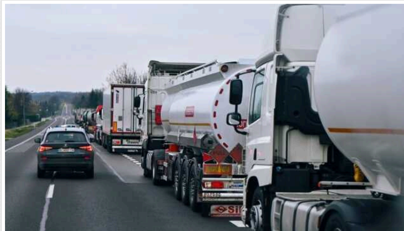
На кордонах України у чергах стоять понад 2700 вантажівок

На кордоні України та Польщі триває блокування руху в трьох пунктах пропуску, де в чергах стоять 1530 вантажівок.