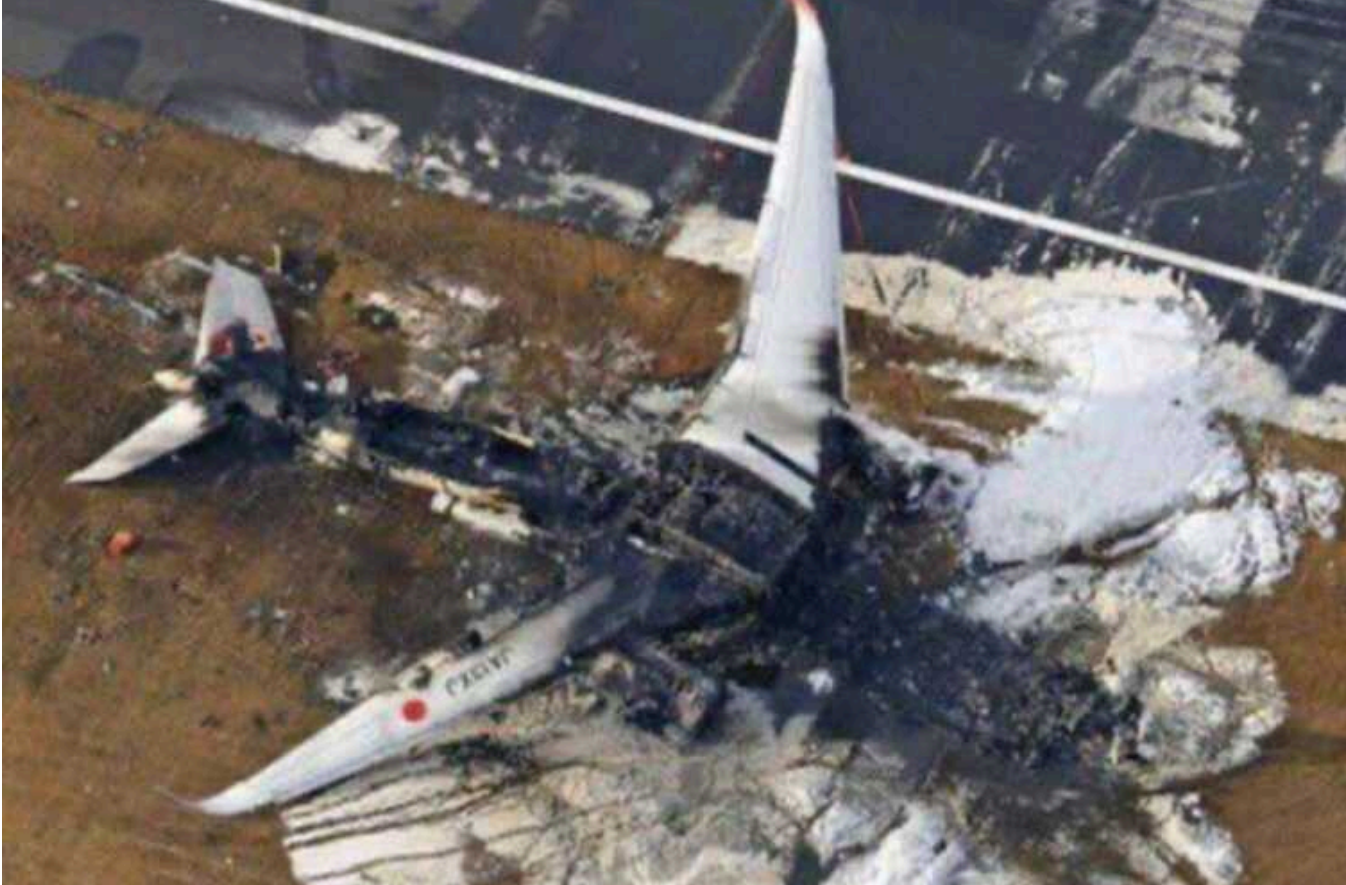
Літак японської авіакомпанії Jaran Airlines, що врізався в літак берегової охорони, вигорів щент

Екіпажу вдалося вчасно евакуювати всіх пасажирів. На борту літака перебувало 379 осіб та 12 членів екіпажу, ніхто з них не постраждав.