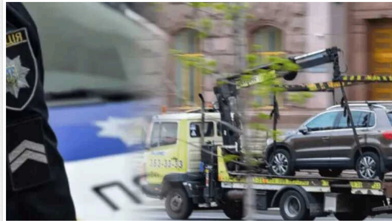
НАЗК подало до суду на поліцію Києва: підозрюють корупцію в оренді землі під штрафмайданчик

Господарський суд Києва відкрив провадження за позовом Національного агентства з питань запобігання корупції (НАЗК) про визнання недійсними договорів оренди землі під штрафмайданчик між комерційною компанією та Головним управлінням Національної поліції у Києві.