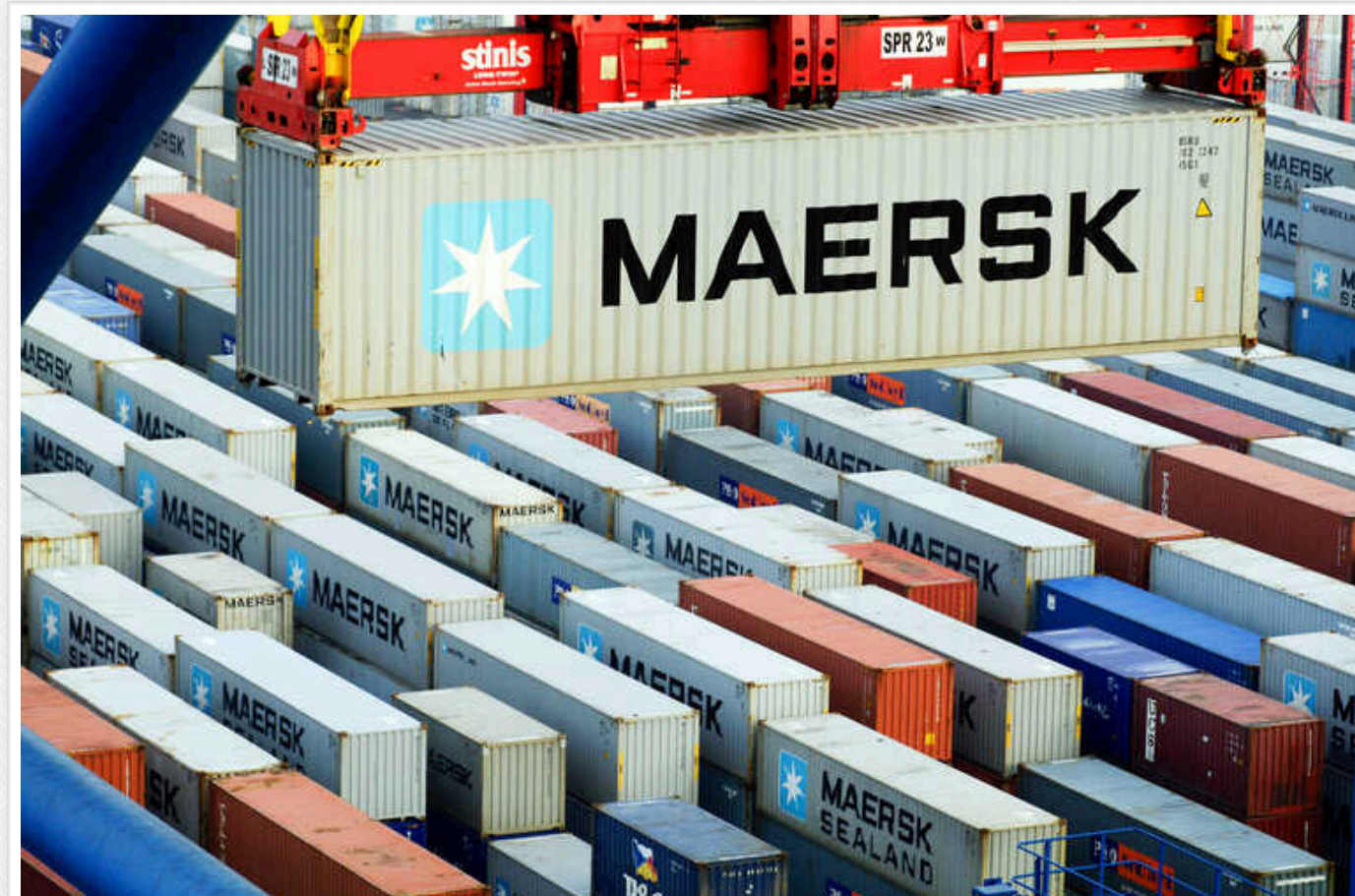
Через напади хуситів Maersk знову зупинив транзит вантажів Червоним морем

Компанія з перевозки вантажів Maersk призупинила судноплавство через Червоне море та Суецький канал "до подальшого повідомлення", оскільки продовжує перевірку безпеки після нападу на одне зі своїх суден через зростання кількості атак на транзитні судна.