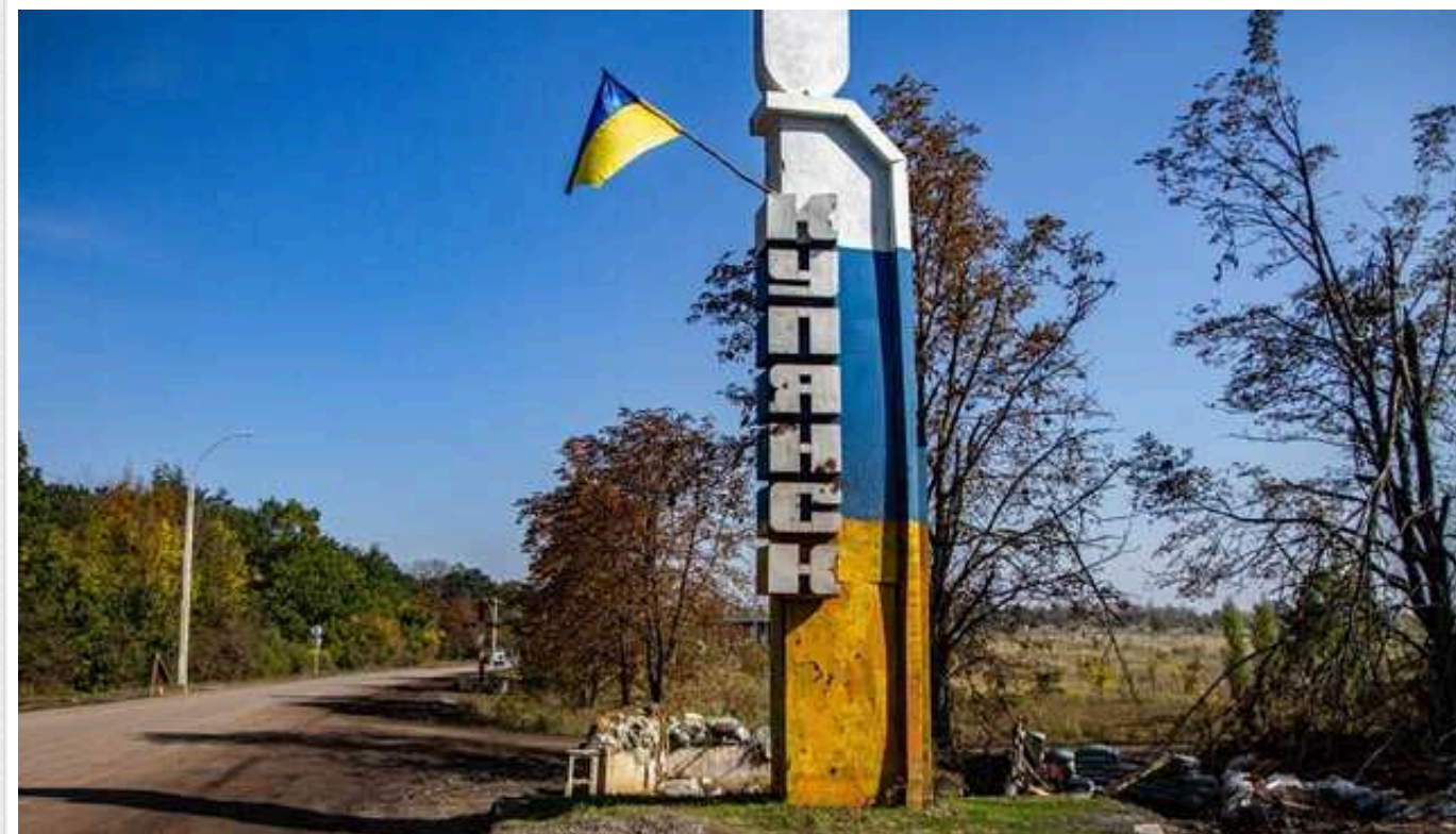
На Куп'янському та Бахмутському напрямках армія РФ продовжує інтенсивний наступ, – Сирський

Під Бахмутом бої продовжуються біля Богданівки, також РФ намагається наступати у напрямку Часового Яру.