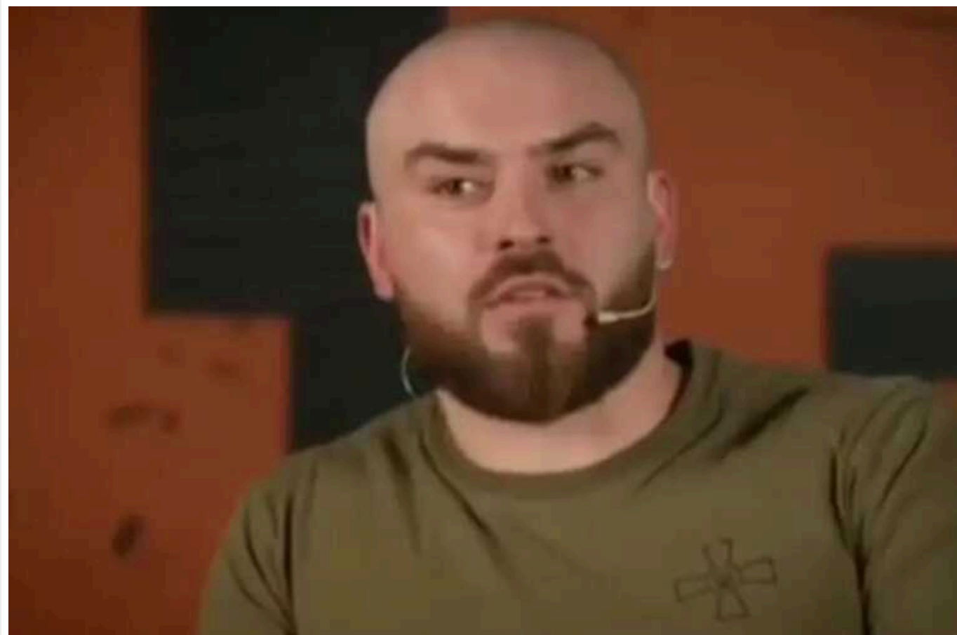
Армія РФ оснащена краще за українську, – командир батальйону 3 штурмової бригади

Так він відповів на запитання хлопця, який запитав, яке у середньостатистичного російського окупанта спорядження і наскільки воно гірше за наше.