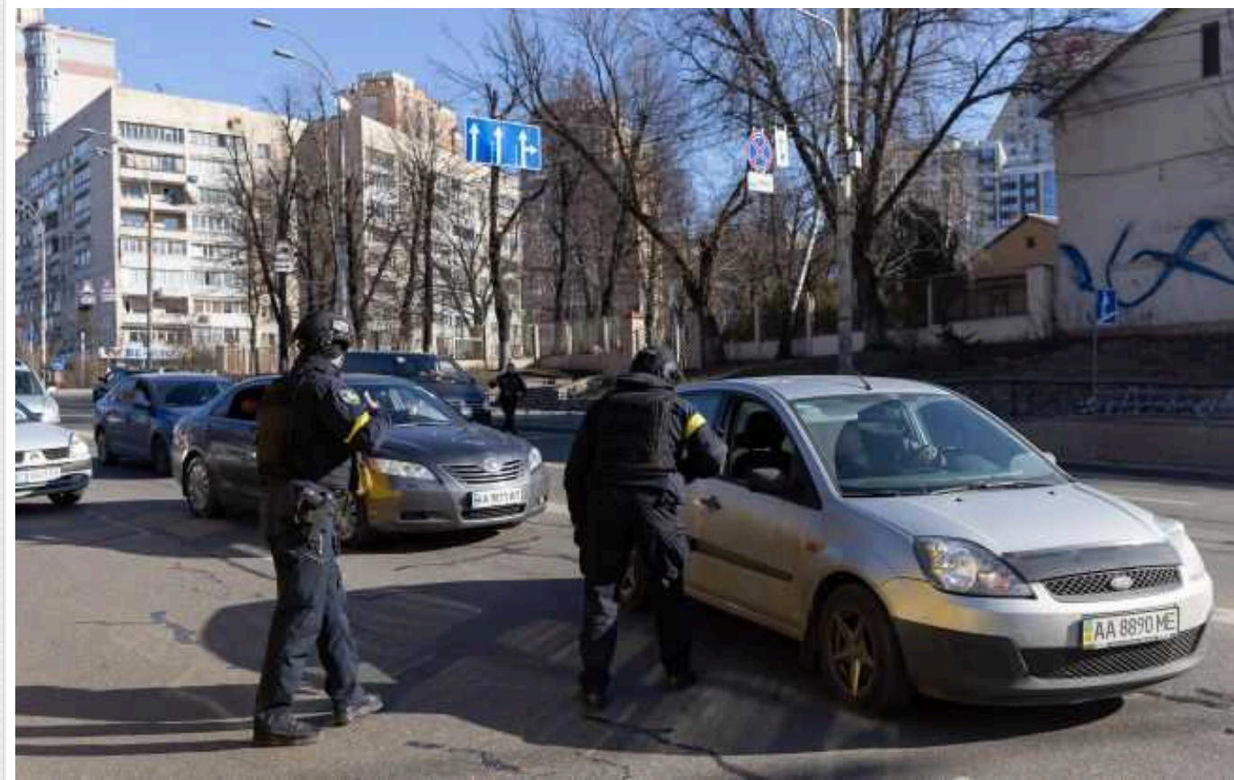
Поліція Київщини спростувала інформацію про видачу повісток на блокпостах

Поліція заперечує, що правоохоронці на блокпостах у Київській області нібито роздавали повістки військовозобов'язаним.