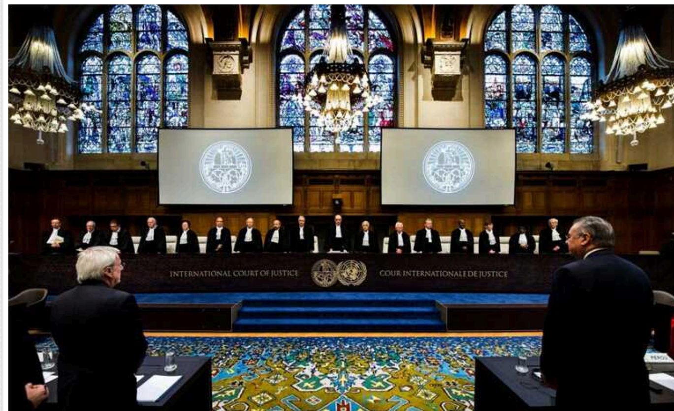
Наступного тижня Міжнародний суд ООН проведе слухання щодо дій Ізраїлю в Секторі Гази

Наступного тижня в Міжнародному суді в Гаазі розпочнуться слухання за позовом Південної Африки, яка звинувачує Ізраїль у вчиненні геноциду проти палестинців у Газі.