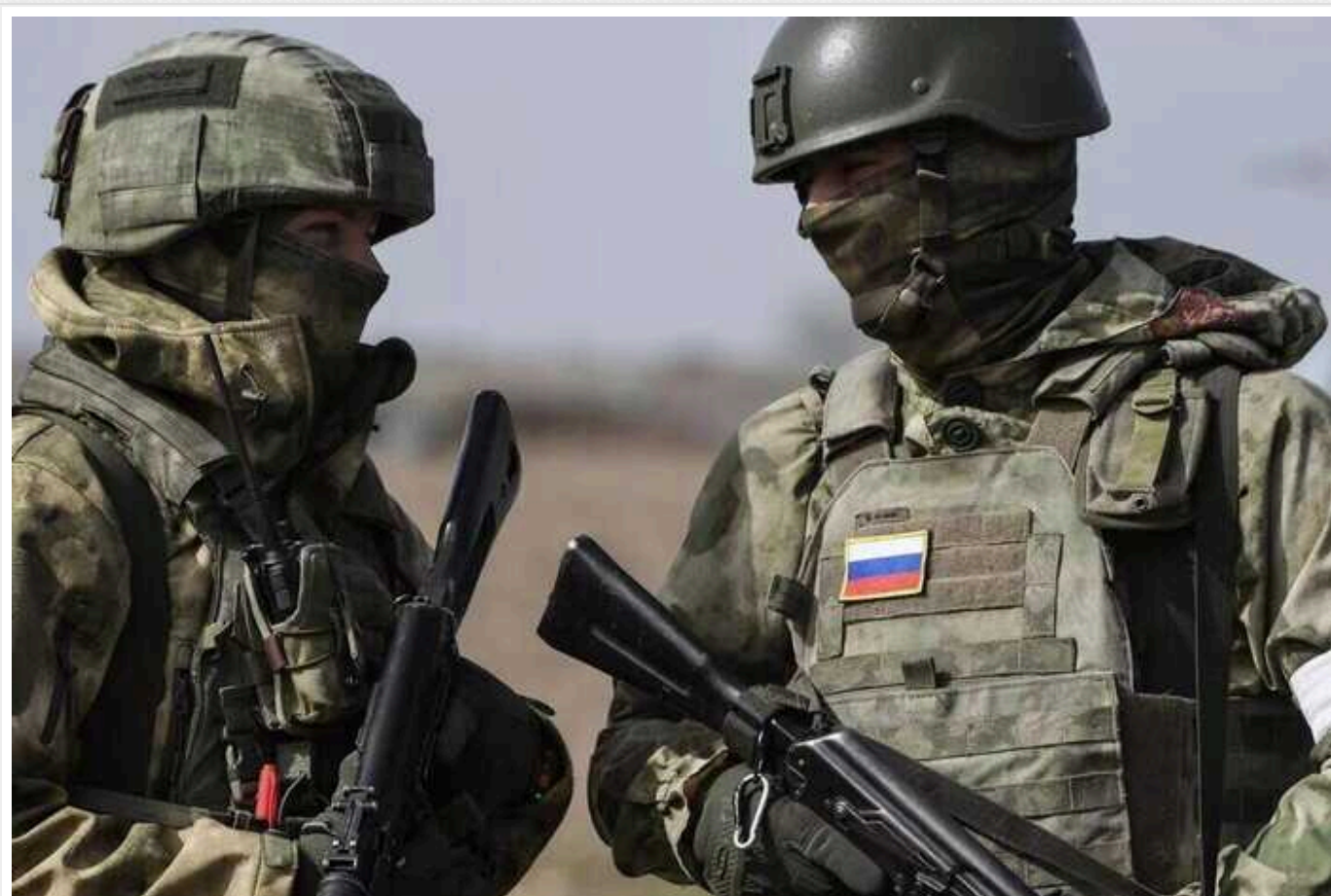
Окупанти обстріляли низку регіонів України: з'явилися дані про нові злочини РФ

Напередодні, 2 січня, російські війська обстрілювали Херсонщину та Донецьчину, там поранені зазнали четверо мирних жителів. Дістался також Харківщині та Нікополю на Дніпропетровщині, а на Запоріжжі Росія вбила двох людей.