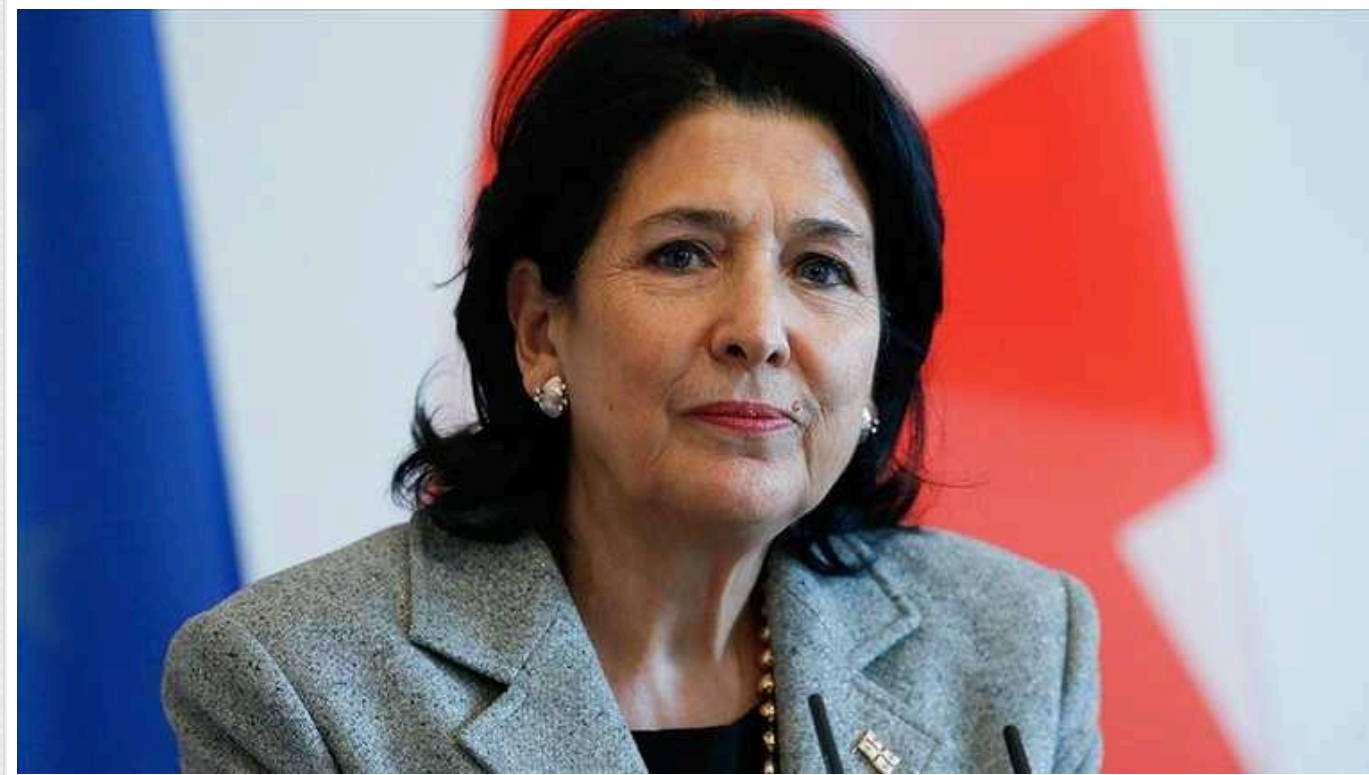
Президентка Грузії Зурабішвілі висловила солідарність з Україною після масованої ракетної атаки окупантів

Президентка Грузії Саломе Зурабішвілі після масованої ракетної атаки Росії на українські міста 2 січня висловила солідарність з Україною.