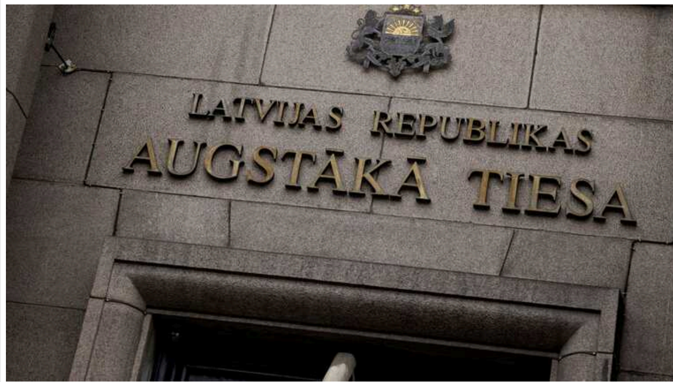
Латвійський суд наказав надати притулок росіянину, який воював за Україну

Адміністративний районний суд наприкінці грудня зобов'язав Латвію надати притулок громадянину Росії, який воював на боці України.