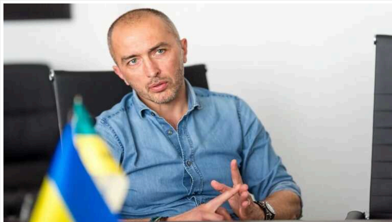
Голову НБУ Пишного визнали найкращим керівником центробанку в Європі та світі

Нагороду присудило британське видання The Banker, яке відзначає посадових осіб, яким найкраще вдалося стимулювати зростання та стабілізувати економіку своїх країн.