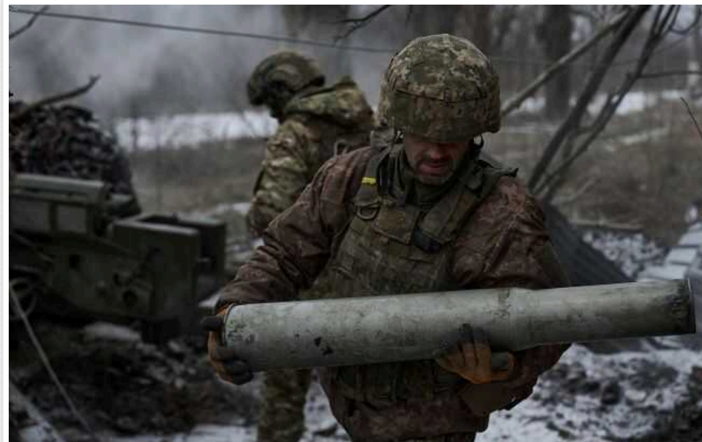
Українські військові просунулися в районі Вербового, окупанти покинули деякі позиції, – Генштаб

Українські війська просунулися в районі Вербового Запорізької області, змусивши окупантів покинути деякі свої позиції.