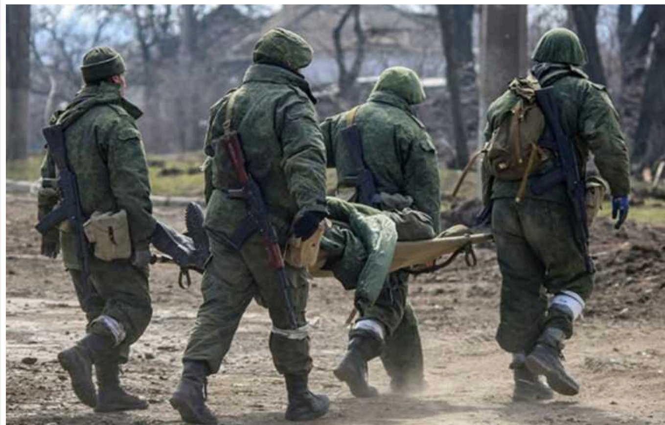
Втрати на фронті: Сили оборони за добу знищили ще 680 окупантів

Сили оборони України за минулу добу ліквідували 680 російських загарбників.