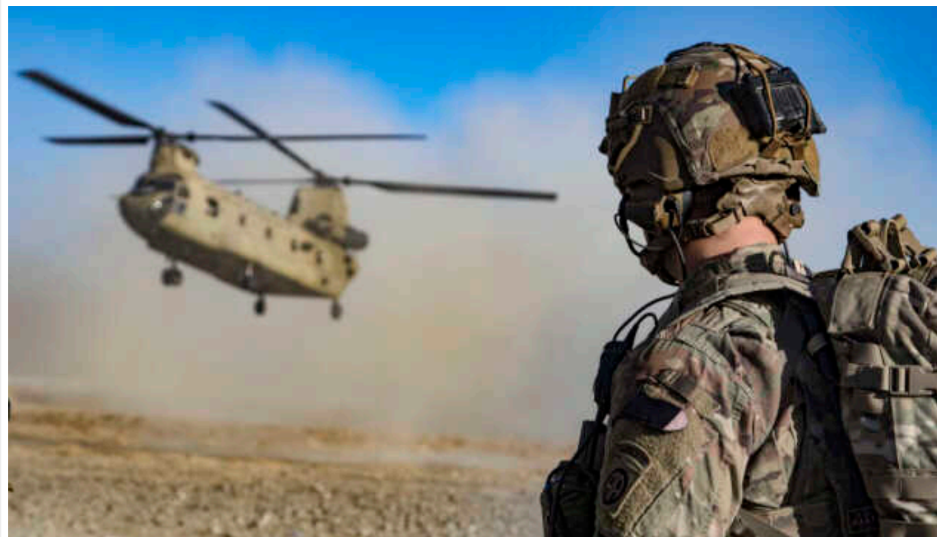
Reuters: Американські війська залишатимуться у Катарі ще десять років

Штати домовилися із Катаром, що ще щонайменше десять років зберігатимуть свою значну військову присутність у країні.