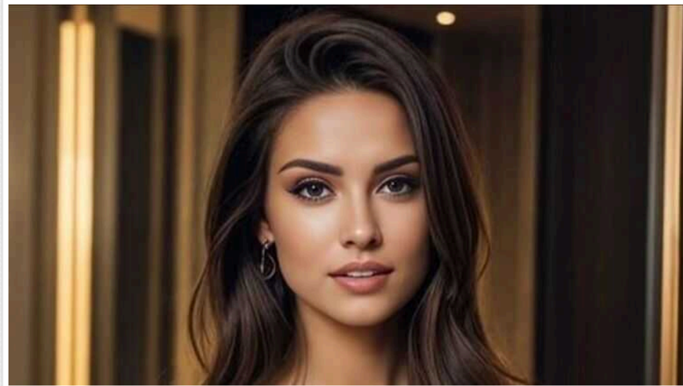
Понад сто тисяч користувачів підписались на модель в інстаграмі, створену з використанням ШІ

На обліковий запис створеної штучним інтелектом інстаграм-моделі Емілі Пеллегріні за чотири місяці підписалися 123 000 користувачів.