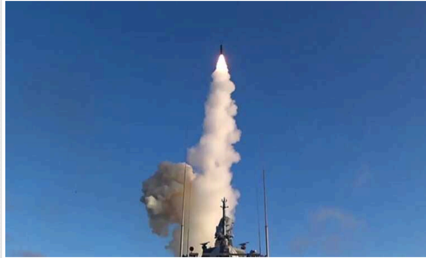
У ЗСУ пояснили, чому окупанти б'ють "Калібрами" менше, ніж X-101 та X-555

Речник Повітряних сил ЗСУ звернув увагу на той факт, що російських кораблів стало менше у Чорному та Азовському морях, що є однією з передумов для меншої інтенсивності запусків "Калібрів".