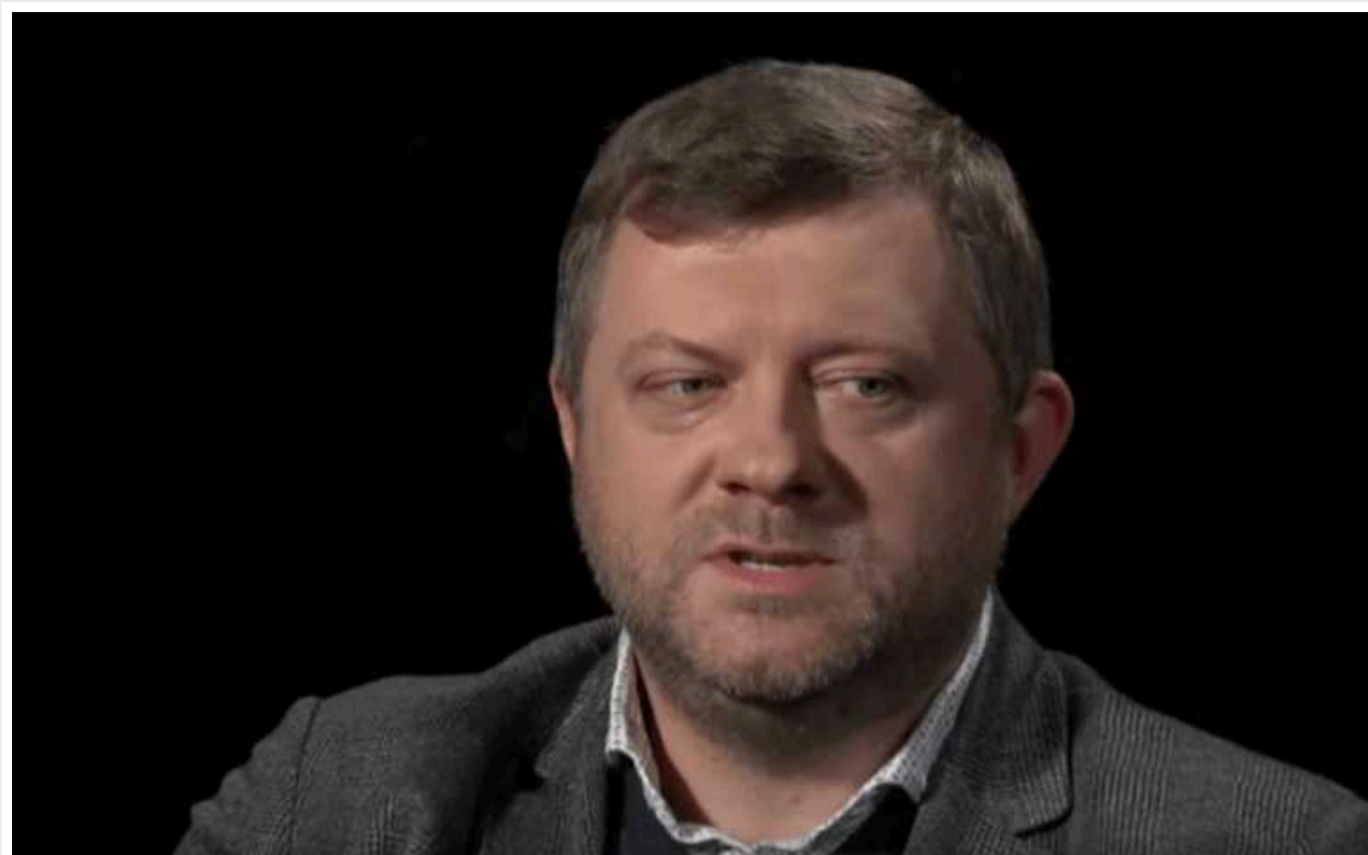
Корнієнко висловив думку, що депутатам не слід мобілізуватися: у 3-й ОШБр відреагували