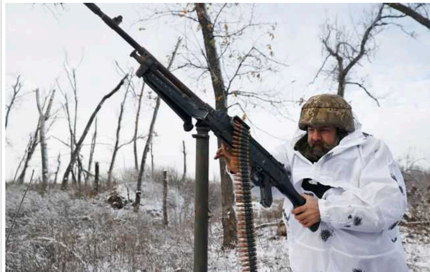
Українські військові в Херсонській області знищили шість російських дронів

Сили оборони України в Херсонській області знищили шість ворожих дронів. Процес знищення вдалося зафіксувати на відео.