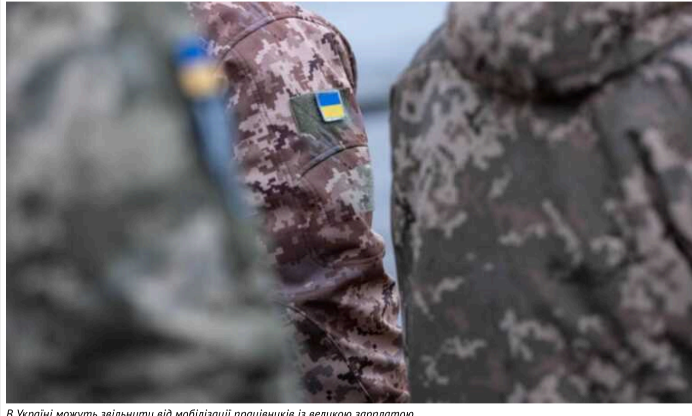
В Україні можуть звільнити від мобілізації працівників із великою зарплатою

Українська влада розглядає можливість оновлення системи мобілізації, яка передбачає включення до списку призовників тих, хто має вищий дохід.