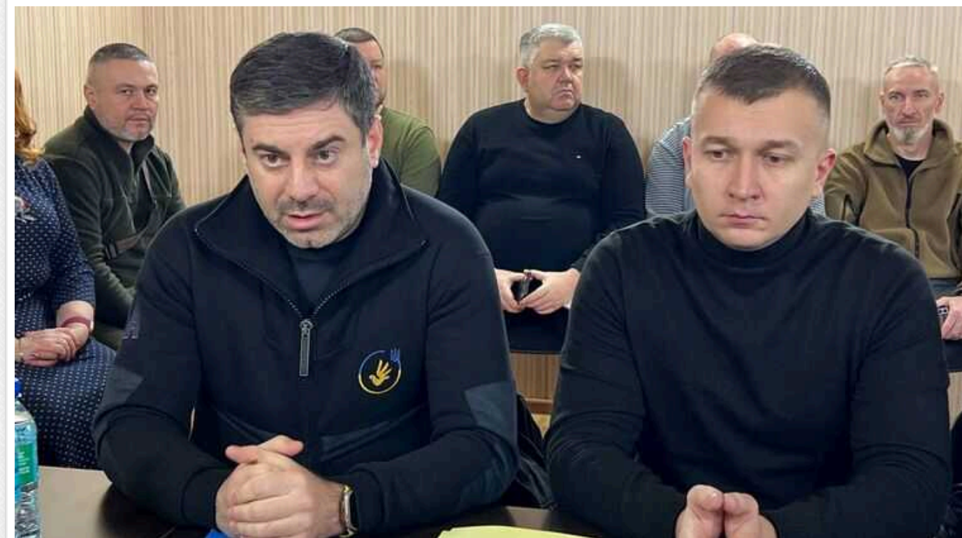
В минулому році українські біженці почали повертатися на Батьківщину, проте зараз вони знову залишають країну, – омбудсмен

У 2023 році настав період, коли біженці почали повертатися в Україну, проте зараз багато хто з них знову висловлює бажання залишити країну.