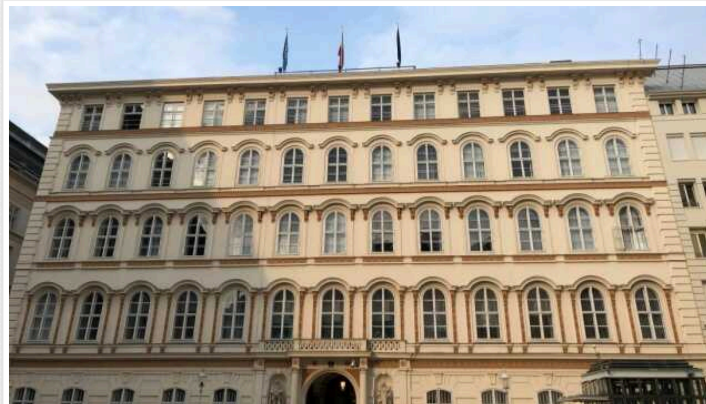
МЗС Австрії вже 10 разів викликало посла РФ через російську агресію проти України

Австрія засуджує агресивну війну Росії проти України та жорстокі атаки на цивільну інфраструктуру, у зв'язку з чим посла РФ вже 10 разів викликали до австрійського МЗС.