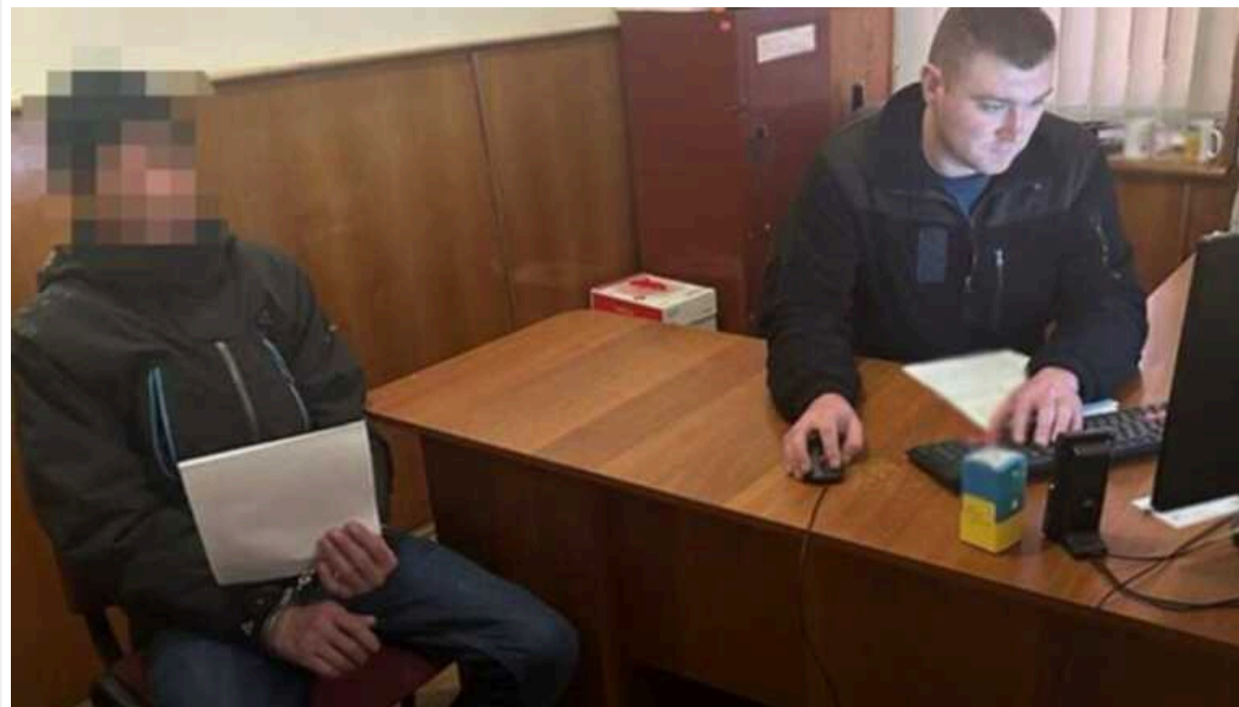
Через побиття у кафе 34-річний мешканець Львівщини потрапив у реанімацію

У одному з кафе у Кам'янці-Бузькій 40-річний чоловік під час сварки сильно побив свого знайомого – 34-річний потерпілий госпіталізований до реанімації. Поліція затримала нападника, йому повідомили про підозру у нанесенні тяжких тілесних ушкоджень.