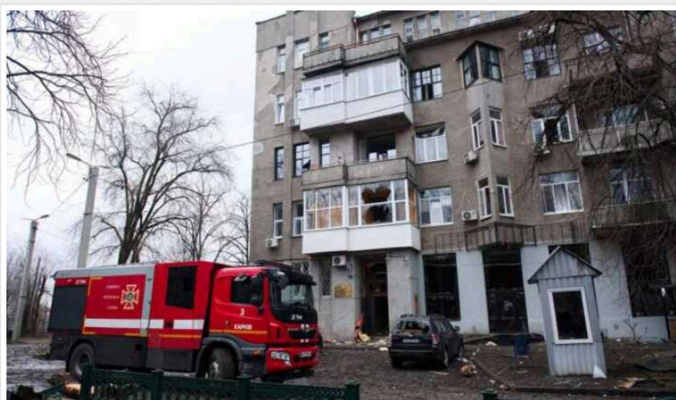
Окупанти знову завдають ударів по Харкову

Навечір 2 січня російські військові знову почали обстрілювати Харків. У місті оголошено повітряну тривогу.