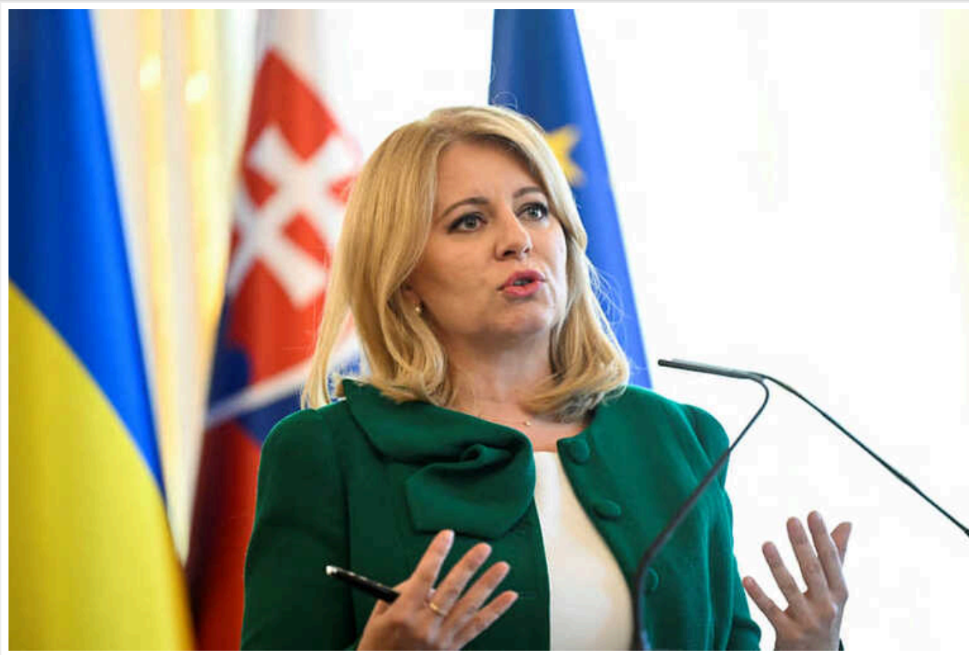
Президентка Словаччини через порушення процедури заблокувала створення нового міністерства

Словацька президентка Зузана Чапутова у вівторок наклала вето на так званий закон про компетенцію, який мав призвести до створення в Словаччині нового Міністерства спорту й туризму, але містить низку додаткових положень і був ухвалений постіхом.