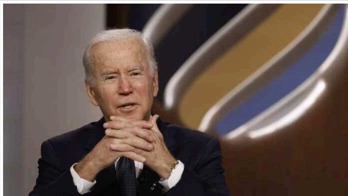
Частина американців вважає Байдена нелегітимним президентом, - опитування

З кінця 2021 року у Сполучених Штатах збільшилась кількість тих, хто вважає нелегітимним обрання Джо Байдена президентом на виборах у 2020-му.