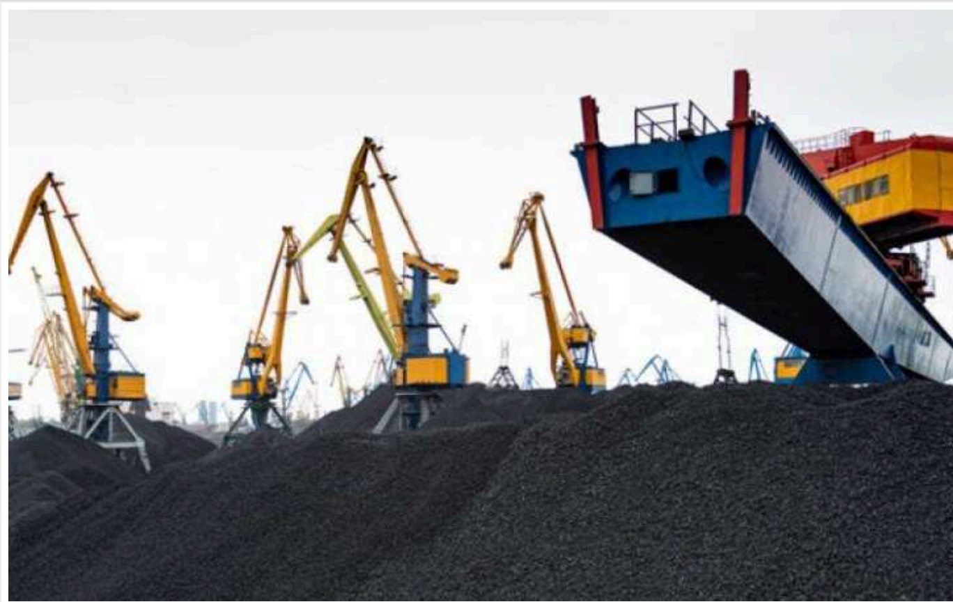
Bloomberg: Китай відновив мито на ввезення вугілля, що може вдарити по російських експортерах

Китай відновив імпорتنі мита на вугілля, і цей крок може поставити під загрозу російських експортерів, які залежать від найбільшого у світі ринку палива.