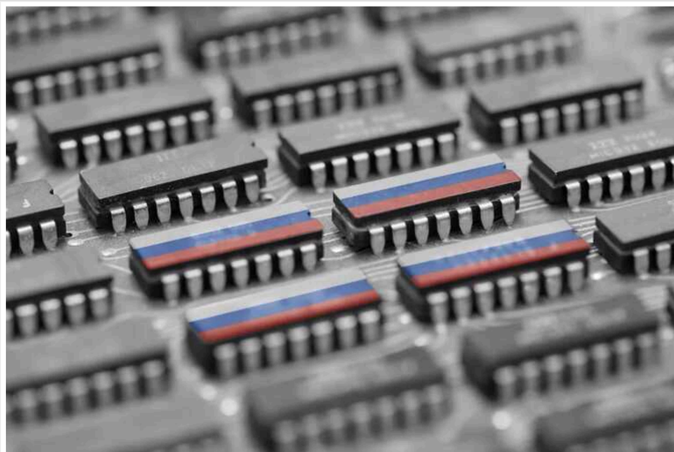
Росія через підставні фірми хоче закупати в Узбекистані електроніку для дронів, - ЦНС

РФ хоче створити та фінансувати на території Узбекистану підставні підприємства для збору безпілотників з іноземних електронних компонентів. Таким чином Москва планує використати Ташкент для обходу міжнародних санкцій, введених через широкомасштабну військову агресію проти України.