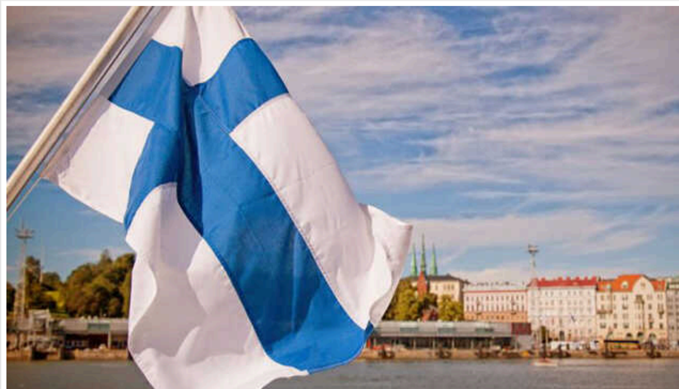
У Фінляндії посилили візові вимоги

Фінляндія підвищила добову фінансову вимогу для мандрівників до 50 євро на день подорожі. Також країна ввела зобов'язання щодо підтримки візи Шенгенської зони стосовно утримання та розміщення.