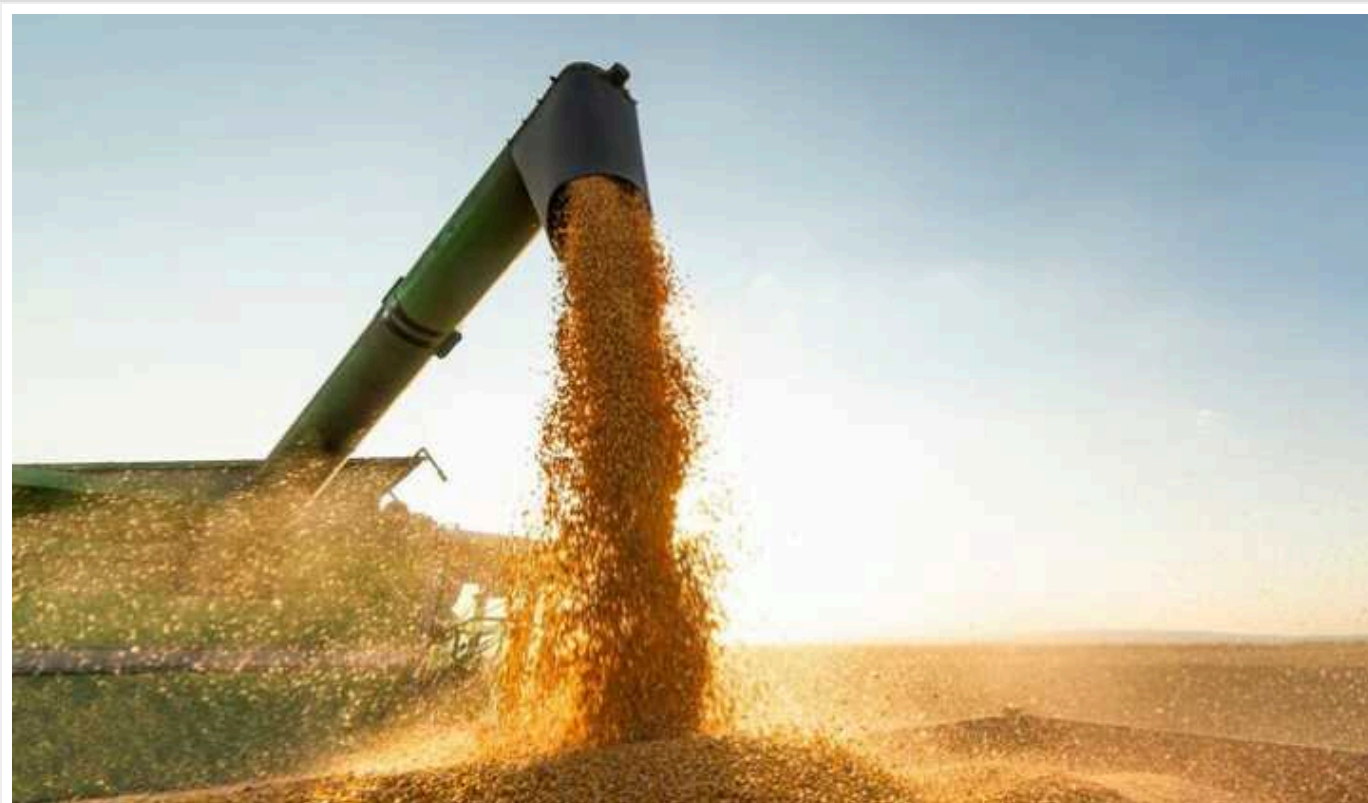
У Польщі новий уряд збереже заборону на ввезення українського зерна

Новий уряд Польщі на чолі з Дональдом Туском збереже заборону ввезення в країну українського зерна.