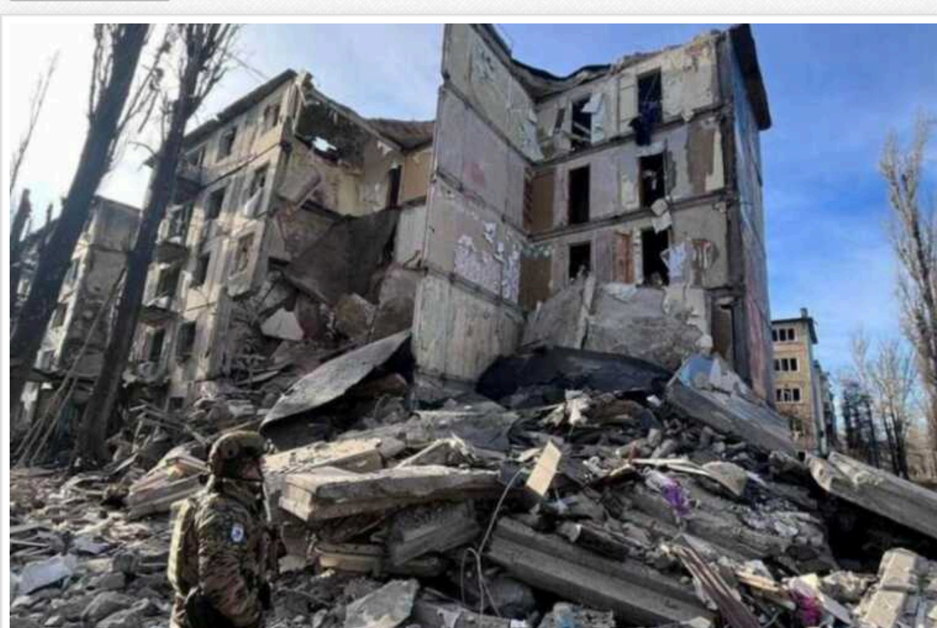
"Братські привіти визволителів": окупанти 26 разів за добу вдарили по мирних об'єктах Донеччини

Армія РФ 26 разів за добу вдарила по цивільному населенню Донецької області.