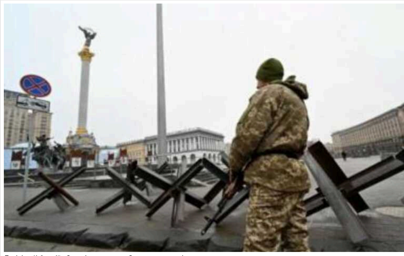
Поліція у Київській області розпочинає облогу на ухилинтів