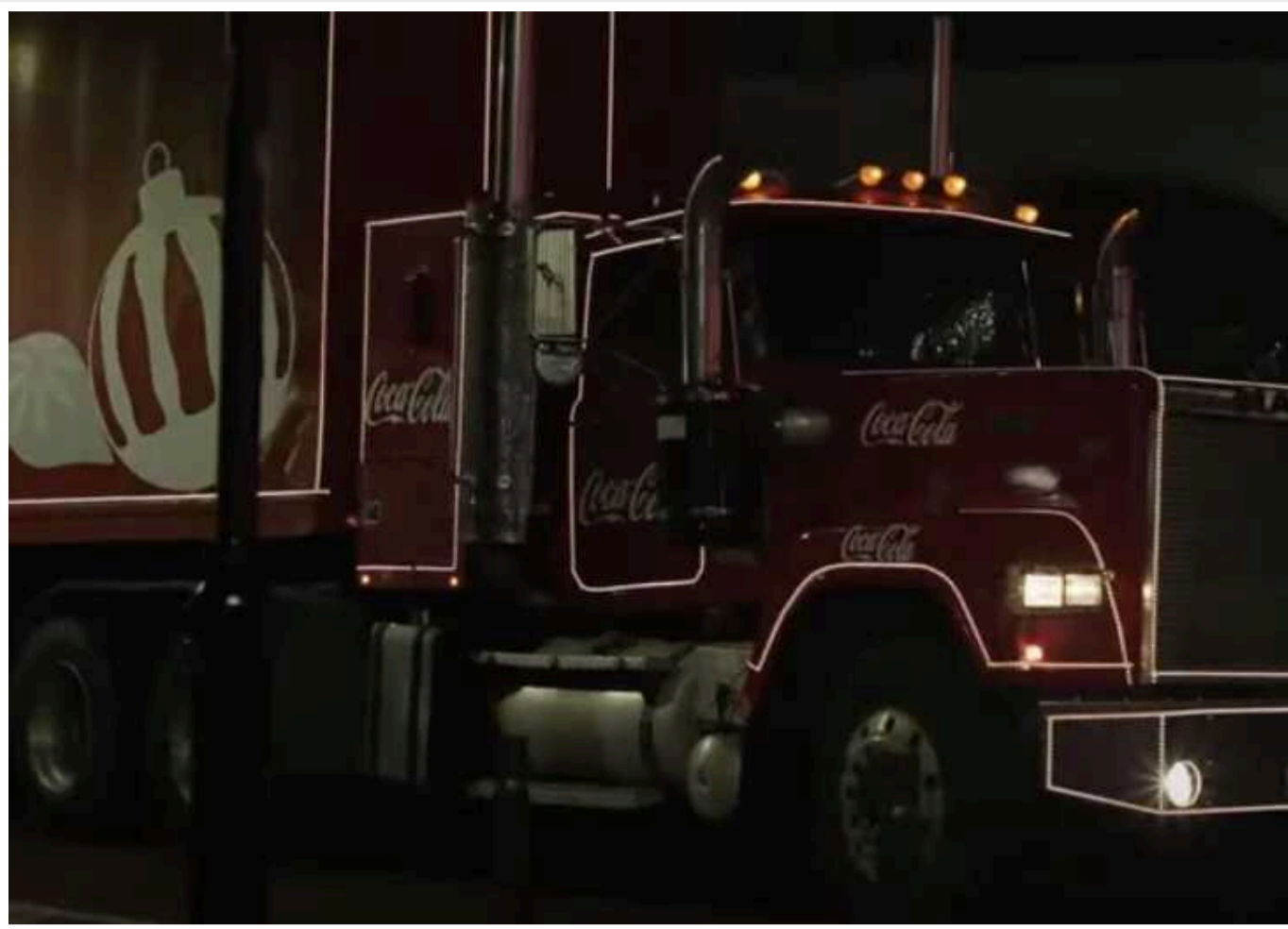
Coca-Cola в новому ролику до Різдва довела, що підтримує РФ

Американський бренд безалкогольних напоїв Coca-Cola з нагоди Різдва зняв реаліті-проект, щоб підтримати людей, день народження яких припадає на кінець грудня. Однак 15-хвилинний зворушливий ролик затьмарила згадка про терористичну Росію.