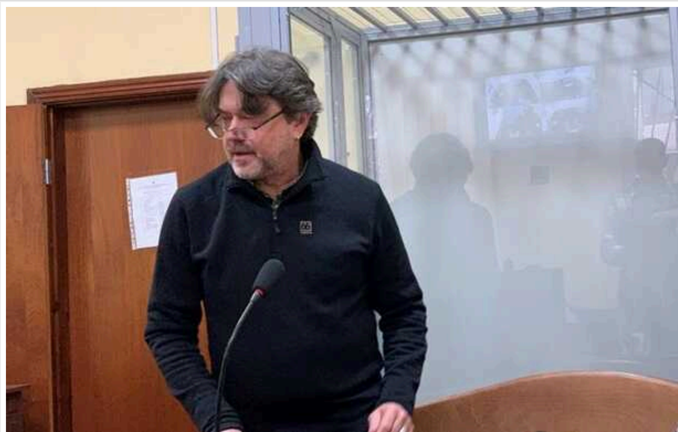
Колега Остапа Ступки, який скоїв у Києві ДТП напідпитку, зізнався, що в театрі кажуть про аварію

Актор Анастолій Гнатюк, який багато років працює в Національному драматичному театрі ім. Івана Франка, розповів, як там відреагували на історію, яка сталася з їхнім колегою Остапом Ступкою. У квітні минулого року відомий артист напідпитку вчинив у Києві ДТП.