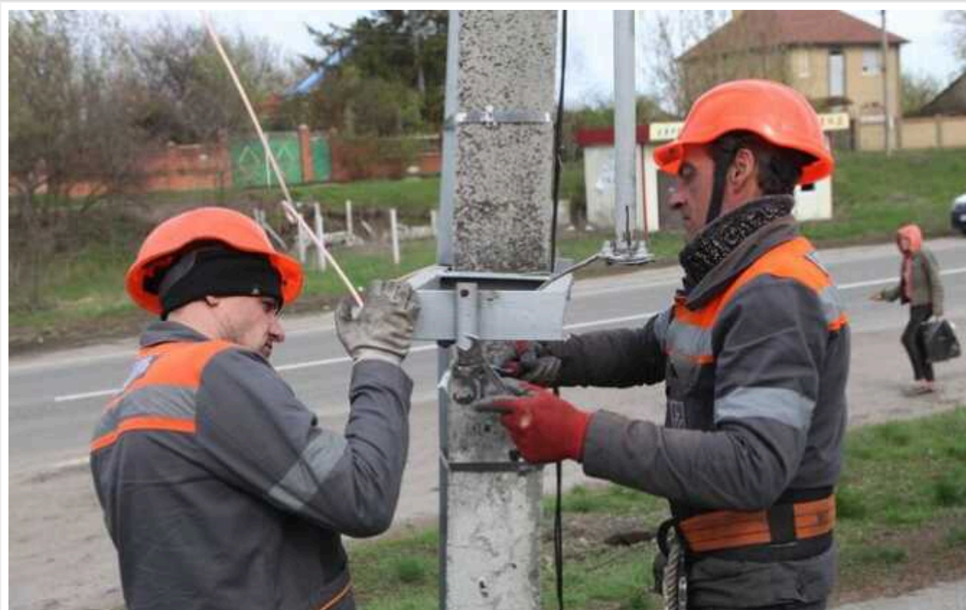
Енергетики обіцяють повернути електрику всім мешканцям Київщини

На Київщині повністю відновлять світло до 19 години сьогодні.