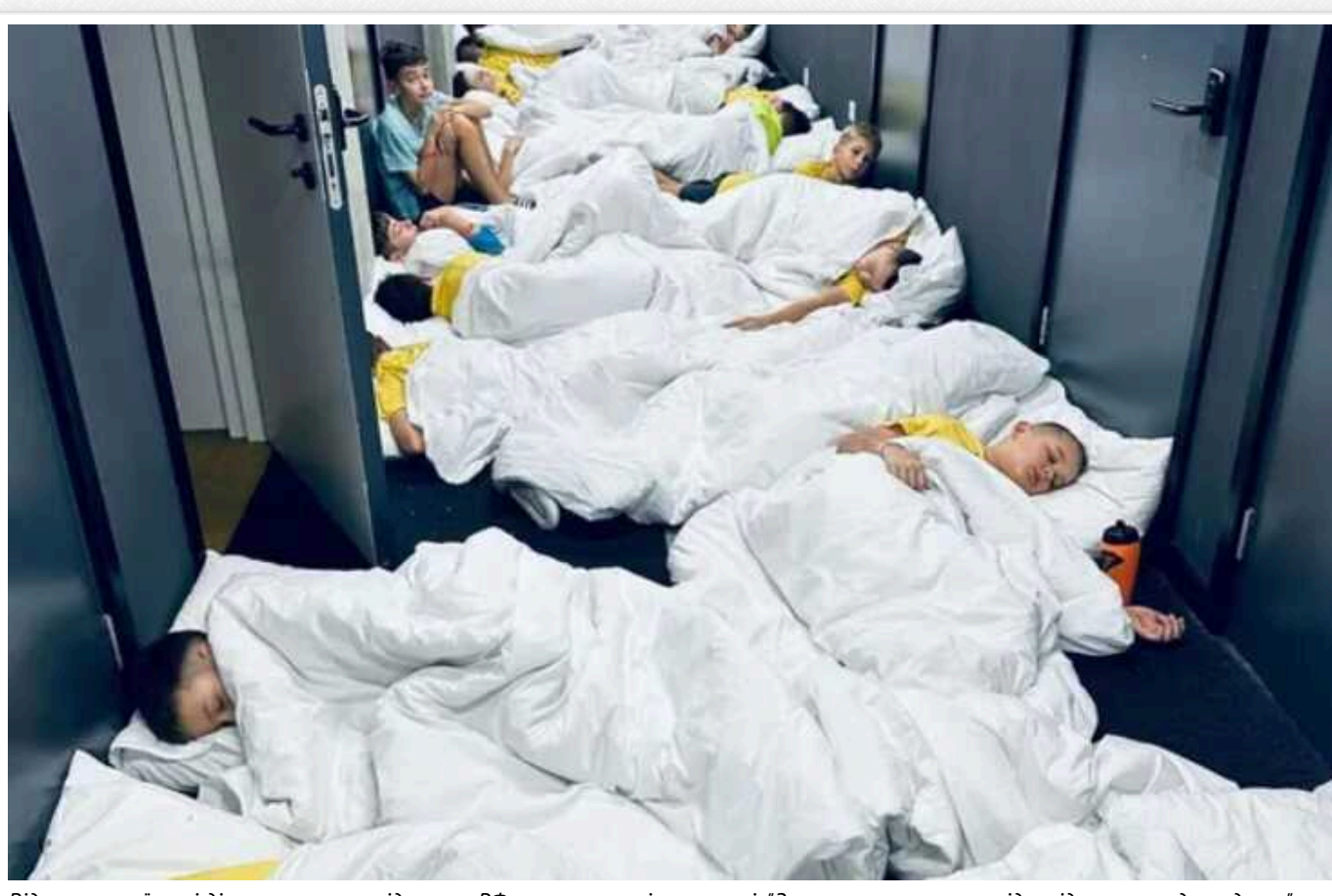
Відео, як українські діти ховаються від ракет РФ, викликало гнів у мережі: "За наших малих вони відповідатимуть дуже довго"

Юні українські футболісти змушені спати в коридорах і навіть у ваннах, а не у своїх звичайних кімнатах під час ракетних ударів Росії по містах нашої країни. Так триває вже тиждень після того, як терористична держава Володимира Путіна відновила атаки на західні області України.