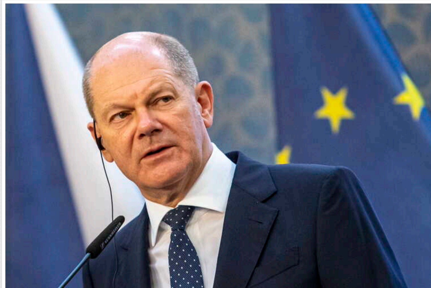
ЗМІ назвали ймовірного наступника канцлера Шольца, якщо той піде у відставку

Канцлер Німеччини Олаф Шольц може достроково залишити посаду канцлера ФРН. Це пов'язано з низьким рівнем підтримки партії "СДПН".