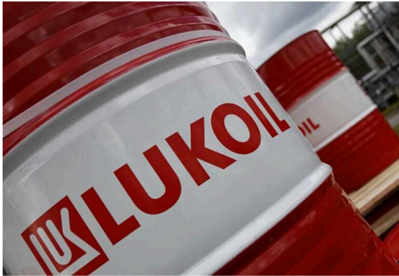
Британський НПЗ продовжує роботу з російським "ЛУКойлом", – Guardian

Один з найбільших нафтопереробних заводів Британії досі продовжує роботу з підрозділом російської нафтової компанії "ЛУКойл".