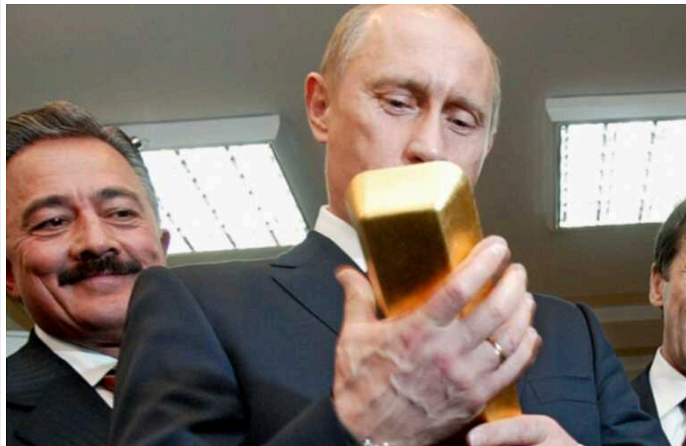
Bloomberg: Статки російських олігархів зросли за рік на 50 мільярдів доларів, попри санкції

Статки найбагатших росіян у 2023 році збільшилися на $50,01 млрд.